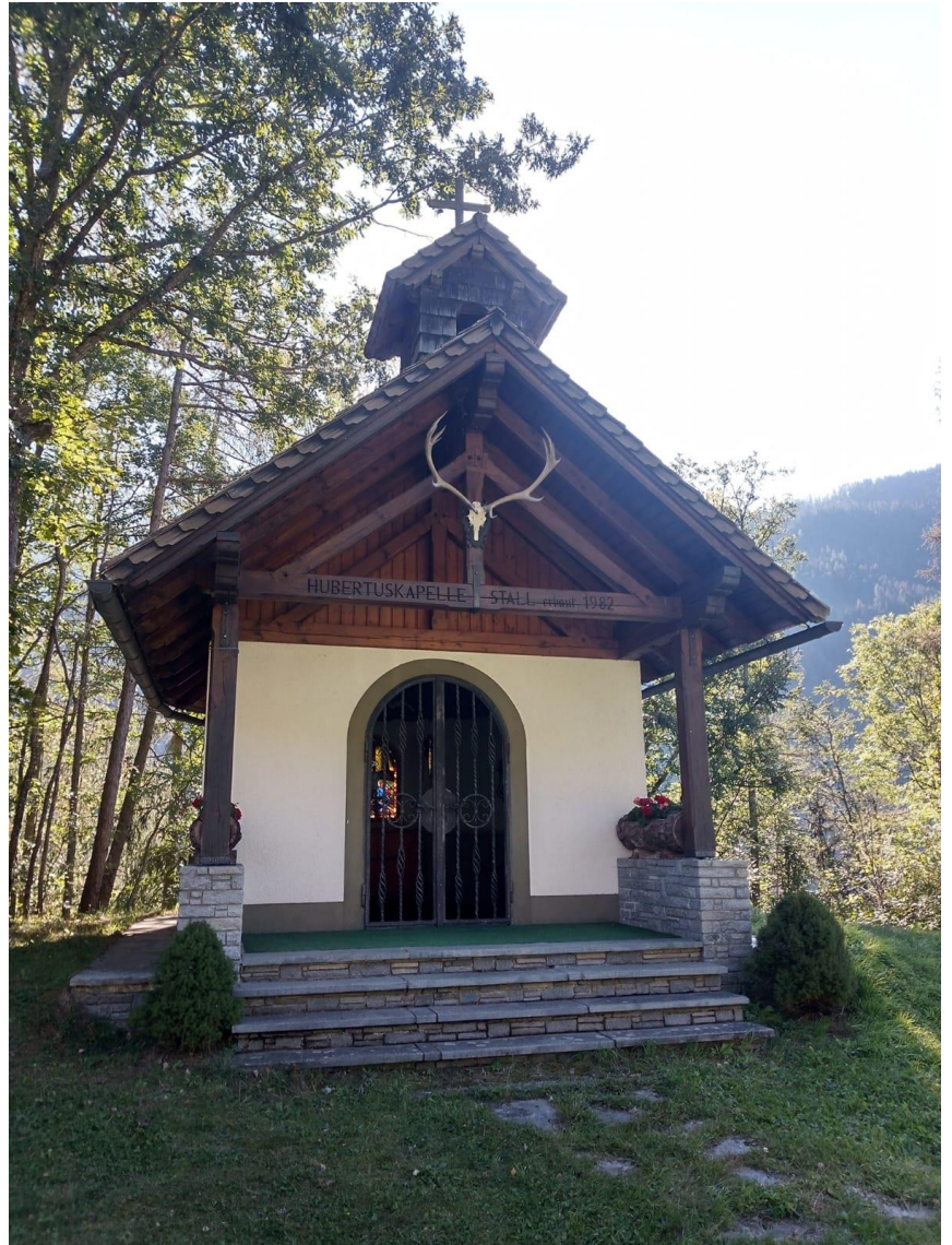
Die Jägerschaft Stall